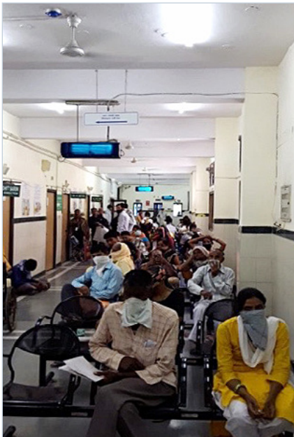
FIGURE 1 Salle d'attente d'un service de consultation externe à ventilation naturelle équipée de ventilateurs de plafond et de dispositifs de stérilisation par UV dans la partie supérieure de la pièce. Institut national de lutte contre la tuberculose et les maladies respiratoires, New Delhi (Inde).