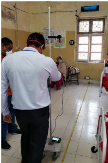
◆ FIGURE 4 Compteur pour système de stérilisation par UV avec capteur à hauteur d'yeux