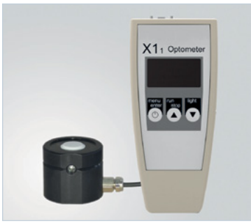
◆ FIGURE 2 Gigahertz-Optik X11 , radiomètre avec détecteur UV-3725 (Puchheim, Allemagne)